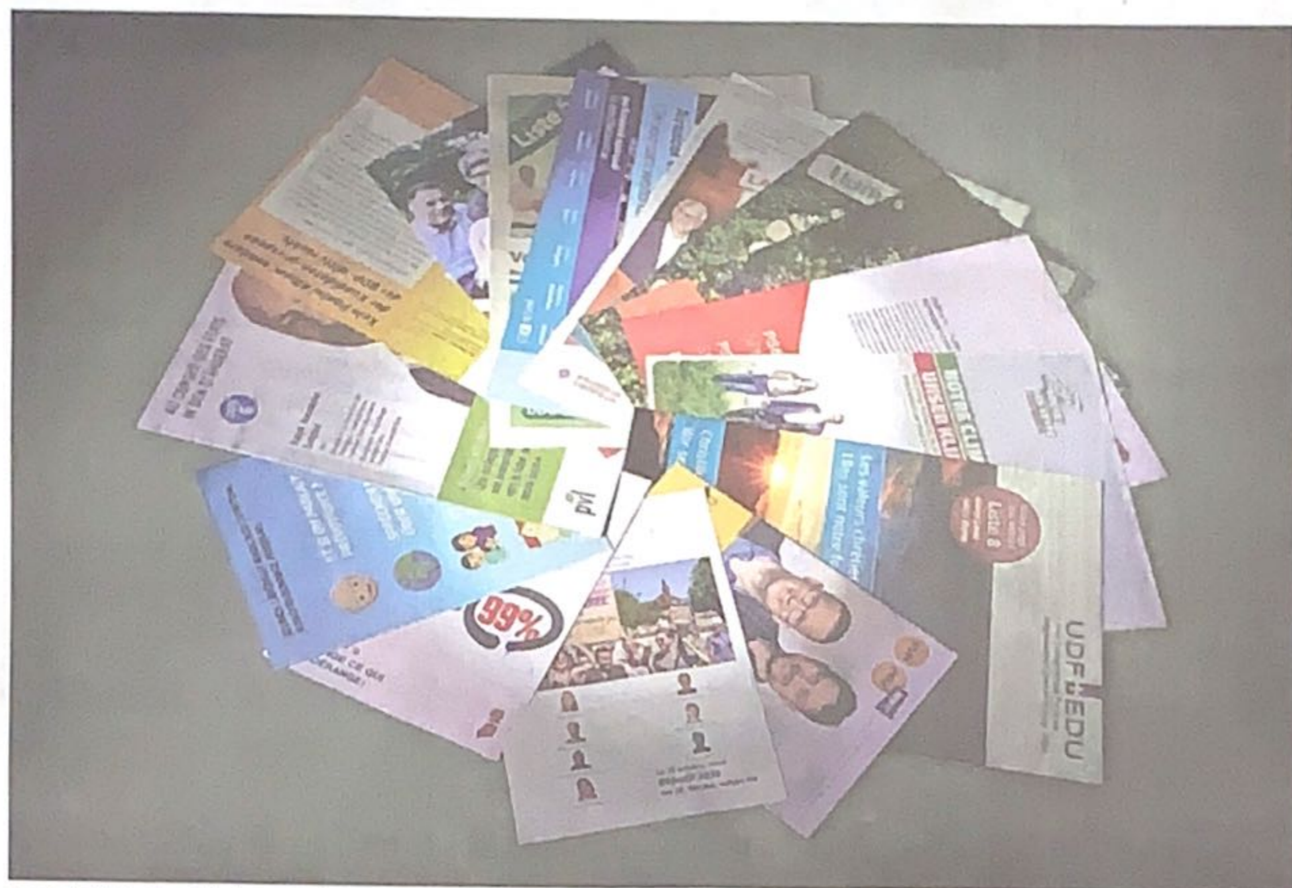
Das Institut Delahaut befragte Freiburgerinnen und Freiburger im Hinblick auf die eidgenössischen Wahlen.

Bulliard-Marbach zeigt sich zufrieden, dass rund 56 Prozent der Befragten ihre Arbeit als sehr gut oder genügend bewerteten. Gleichzeitig weist sie auf einen Schwachpunkt der Umfrage hin: «Es gibt nur «sehr gut» oder «genügend». Es fehlt ein «gut». Das finde ich speziell.»